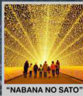
"NABANA NO SATO"