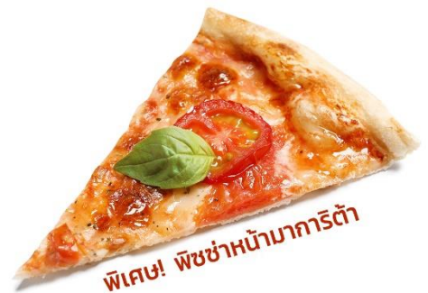
พิเศษ! พิซซ่าหน้ามาการิตต้า

เย็น ๑๐ รับประทานอาหารเย็น (มือที่2) เมนูพิเศษ!! พิซซ่าหน้ามาการิตต้า ที่พัก: Hotel Galilei หรือระดับใกล้เคียงกัน (ชื่อโรงแรมที่ท่านพักทางบริษัทจะทำการแจ้งพร้อมใบนัดหมาย 5-7 วันก่อนวันเดินทาง)