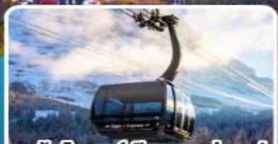
กระเช้า ไอเกอร์เอ็กสเพรส สู่อยอดเขาจุงเฟรา

อิตาลี สวิตเซอร์แลนด์ ฝรั่งเศส 10 วัน 7 คืน