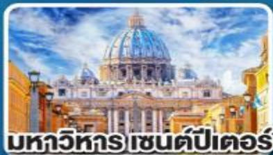
มหาวิหาร เซนต์ปีเตอร์