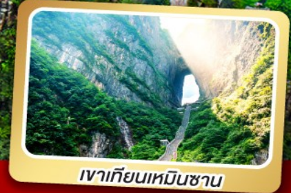
เขากเทียนเหมินซาน

ทริปเดียวเที่ยว 2 เมืองโบราณ ฝูหลงและเฟิ่งหวง ลิ้มรส สุกี้หืด บั๊ยง่างเกาหลี เปิดปิกนิก