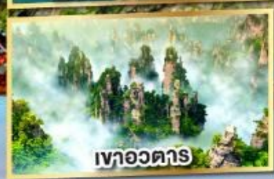
เขาอวดตาร