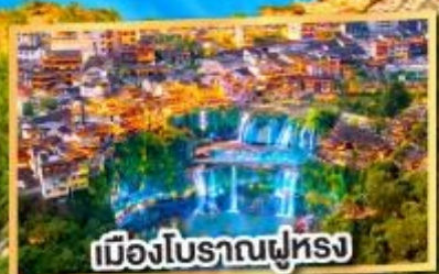
เมืองโบราณฟูหลง