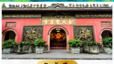
วัดต้าฉือ