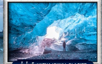
ถ้ำน้ำแข็ง VATNAJOKULL GLACIER

บินทรู สายการบิน Full Service | พิเศษ! ทานอาหารโดมกระจกิว 360 องศา