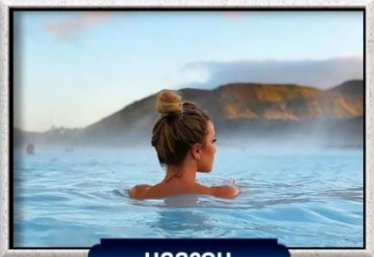
บลูลากูน