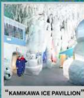
"KAMIKAWA ICE PAVILLION"