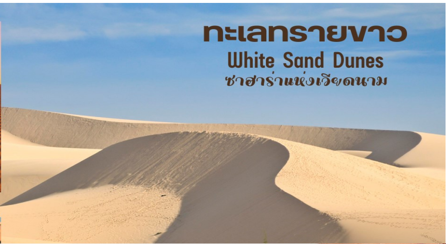
ทะเลทรายขาว White Sand Dunes ซาฮาราแห่งเวียดนาม