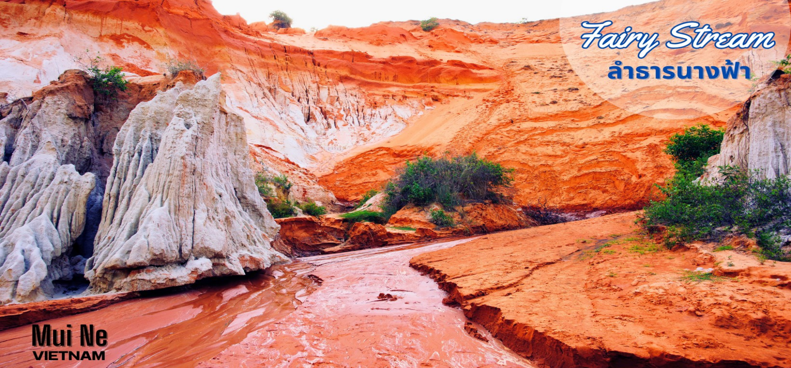
Fairy Stream ลำธารนางฟ้า