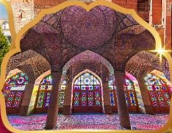
Nasir al Molk Mosque