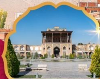
Ali Qapu Palace