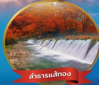
ลำธารสลับกอง