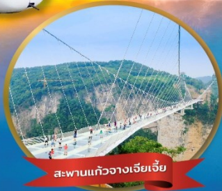
สะพานแก้วจางเจียเจีย