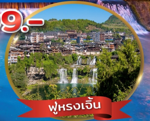
ฟูหรงเจิน