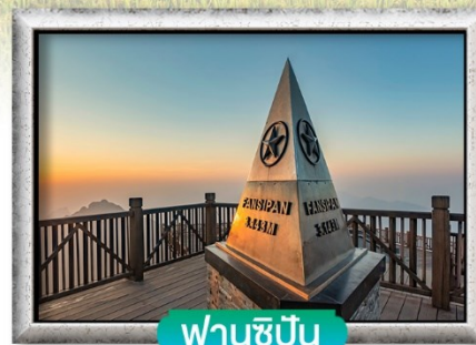
ฟานชีปัน