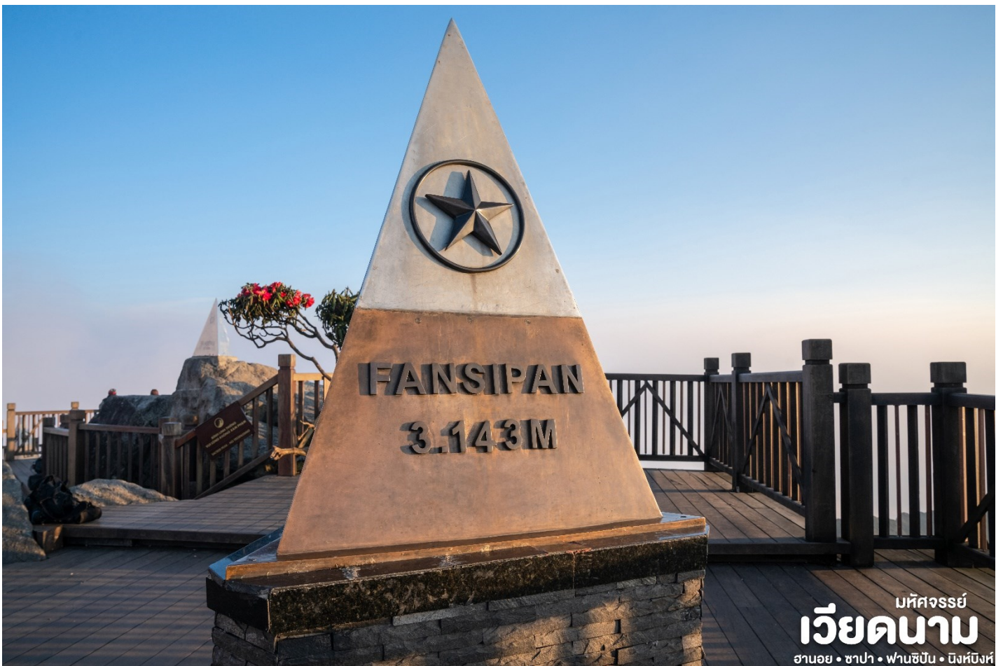
มหิศจรรย์ เวียดนาม ฮานอย • ซาปา • ฟานซิปัน • นิงห์บิงห์