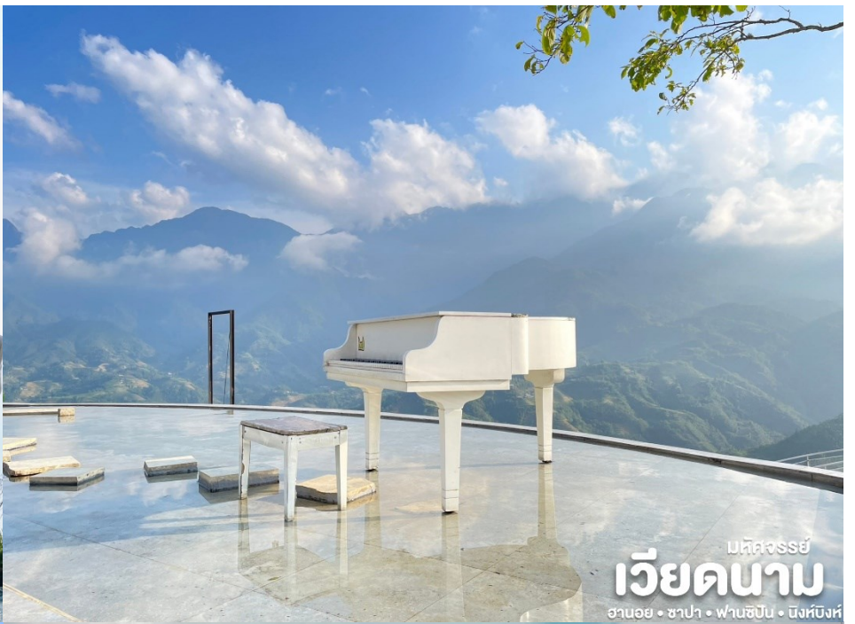
มหิตจรรย์ เวียดนาม ฮานอย • ซาปา • ฟานซิปัน • นิงห์ฮงห์