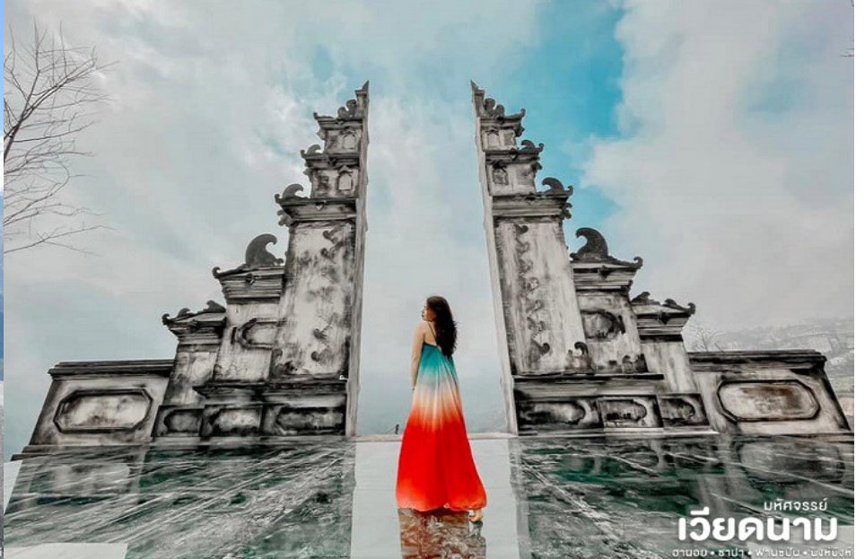
มหิตจรรย์ เวียดนาม ฮานอย • ซาปา • ฟานซิปัน • นิงห์ฮงห์

เย็น ๑๗ บริการอาหารเย็น ณ ร้านอาหาร เมนูพิเศษ ชาบูหม้อไฟปลาแซลมอล+ไวน์แดงดालัด จากนั้นพาทุกท่านชม ตลาดซาปา ซึ่งมากมายไปด้วยชาวเขาเผ่าต่างๆ ที่ออกมาจับจ่ายซื้อขายกัน อย่างมีสีสัน จากนั้น สมควรแก่เวลานำท่านเข้าที่พัก SAPA CHARM HOTEL 4* หรือเทียบเท่ามาตรฐานเวียดนาม (โรงแรมที่ระบุในรายการทัวร์เป็นเพียงโรงแรมที่นำเสนอเบื้องต้นเท่านั้น ซึ่งอาจมีการเปลี่ยนแปลงแต่โรงแรมที่เข้า พักจะเป็นโรงแรมระดับเทียบเท่ากัน)