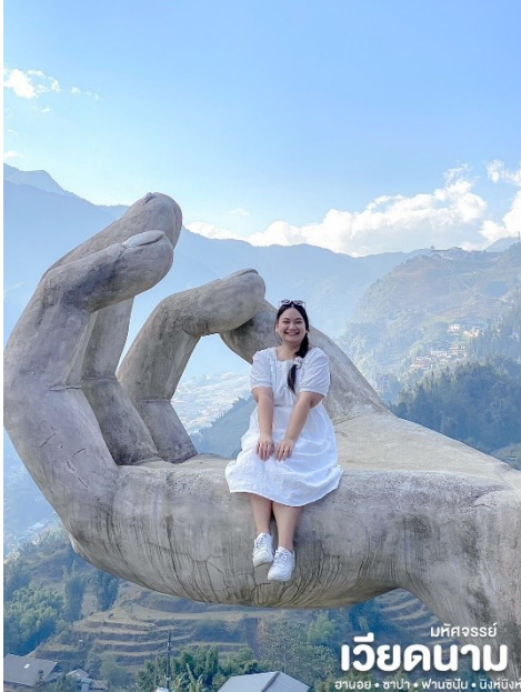
มหิตจรรย์ เวียดนาม ฮานอย • ซาปา • ฟานซิปัน • นิงห์ฮงห์