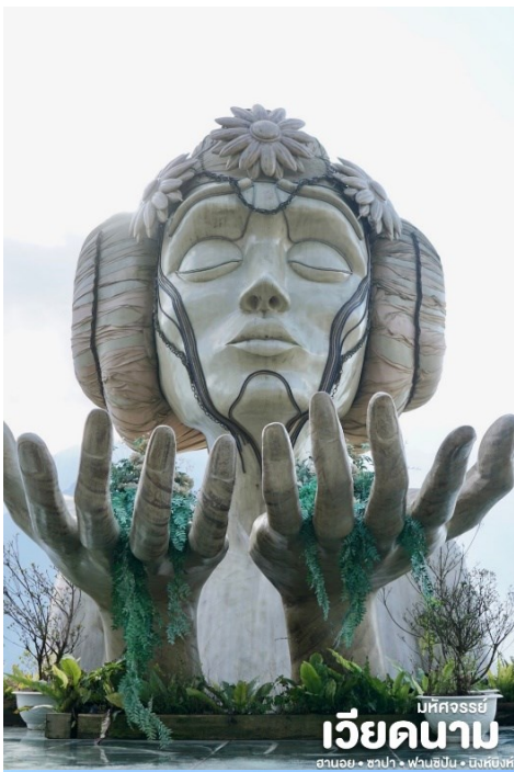
มหิตจรรย์ เวียดนาม ฮานอย • ซาปา • ฟานซิปัน • นิงห์ฮงห์