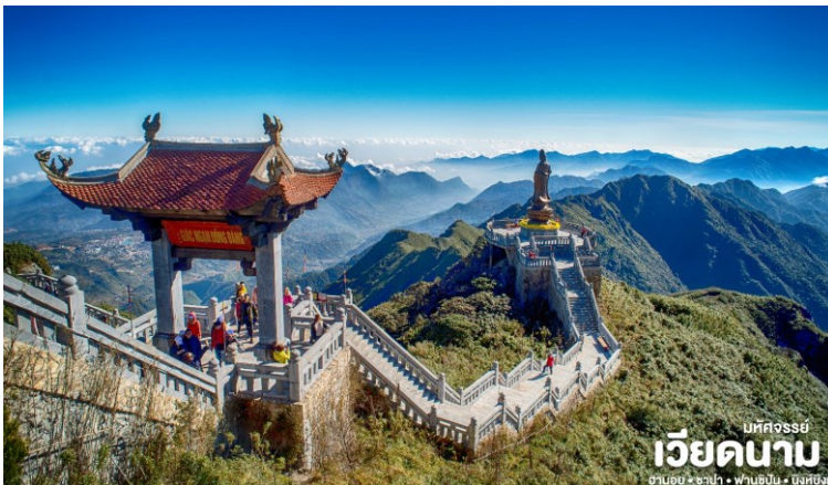
มหิศจรรย์ เวียดนาม ฮานอย • ซาปา • ฟานซิปัน • นิงห์บิงห์