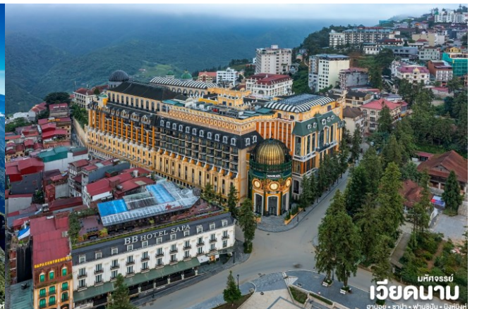
มหิศจรรย์ เวียดนาม ฮานอย • ซาปา • ฟานซิปัน • นิงห์บิงห์

เย็น จากนั้น 📍 บริการอาหารเย็น ณ ร้านอาหาร สมควรแก่เวลานำท่านเข้าที่พัก SAPA CHARM HOTEL 4* หรือเทียบเท่ามาตรฐานเวียดนาม (โรงแรมที่ระบุในรายการทัวร์เป็นเพียงโรงแรมที่นำเสนอเบื้องต้นเท่านั้น ซึ่งอาจมีการเปลี่ยนแปลงแต่โรงแรมที่เข้าพักจะเป็นโรงแรมระดับเทียบเท่ากัน)