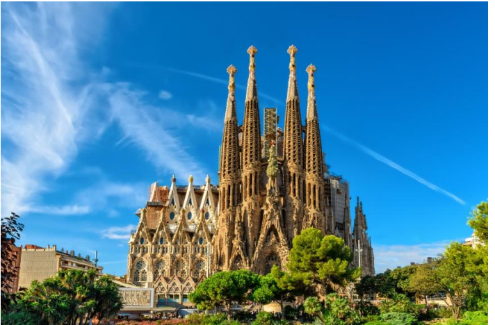
ได้เวลาพอสมควรนำท่านออกเดินทางสู่