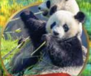
หมีแพนด้าเจียงเยี่ยน