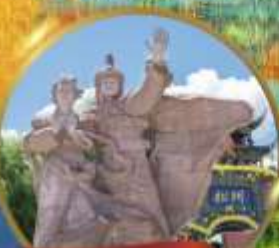
เมืองโบราณชงพาน