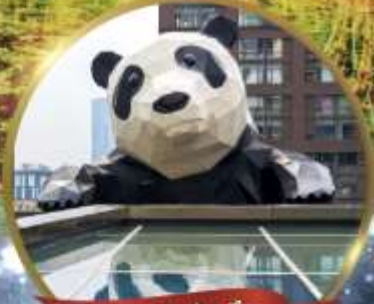
แพนด้ายักษ์

มหัศจรรย์ความงาม อุทยานจิวจ้ายโกว (รวมรถเหมาเที่ยวอุทยานเต็มวัน) ชมอุทยานหวงหลง (รวมกระเช้า) • สี่ฤดู • อุทยานชวงเจียวโกว (รวมรถอุทยาน) เมืองเก่าชงพาน • ถนนคนเดินจินหลี่ + ไถ่กู่หลี่ • ชมแพนด้ายักษ์ป็นตึก