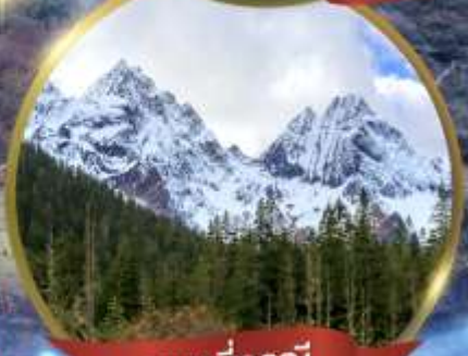
ภูเขาสี่ฤดู