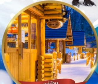
หมู่บ้าน NINGLE TERRACE

สนุกสนาน ณ ลานสกี • หมู่บ้านราเมนอาซาฮิคาว่า • หมู่บ้านนิงเกิลเทอเรส ขบวนพาเหรดเพนกวิน ณ สวนสัตว์อาซาฮิคาว่า • โรงงานช็อกโกแลต โอดารุ • ศาลเจ้าออกไกโด • พระใหญ่ HILL OF BUDDHA