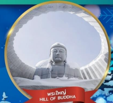
พระใหญ่ HILL OF BUDDHA