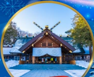
ศาลเจ้าออกไกโด

พักอาซาฮิคาว่า 1 คืน - โอดารุ 1 คืน - ซัปโปโร 2 คืน (ติดย่านช้อปปิ้ง)