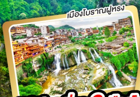
เมืองโบราณฝูหลง