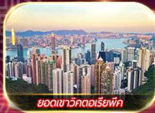
ยอดเขาวิกตอเรียพีค