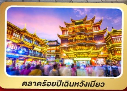
ตลาดร้อยปีเงินหวงเมี่ยว