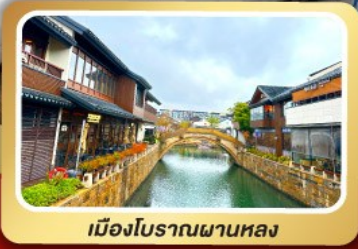
เมืองโบราณผานหลง