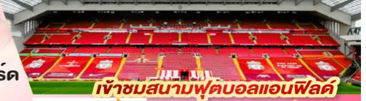
เข้าชมสนามฟุตบอลแอนฟิลด์