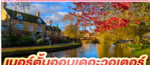
เบอร์ตันออนเดอะวอเตอร์