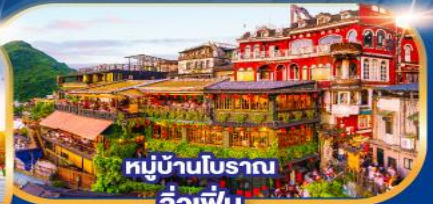
หมู่บ้านโบราณ จิวเฟิ่น