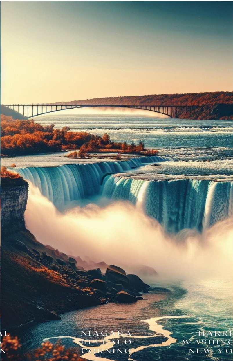
NIAGARA BUFFALO CORNING