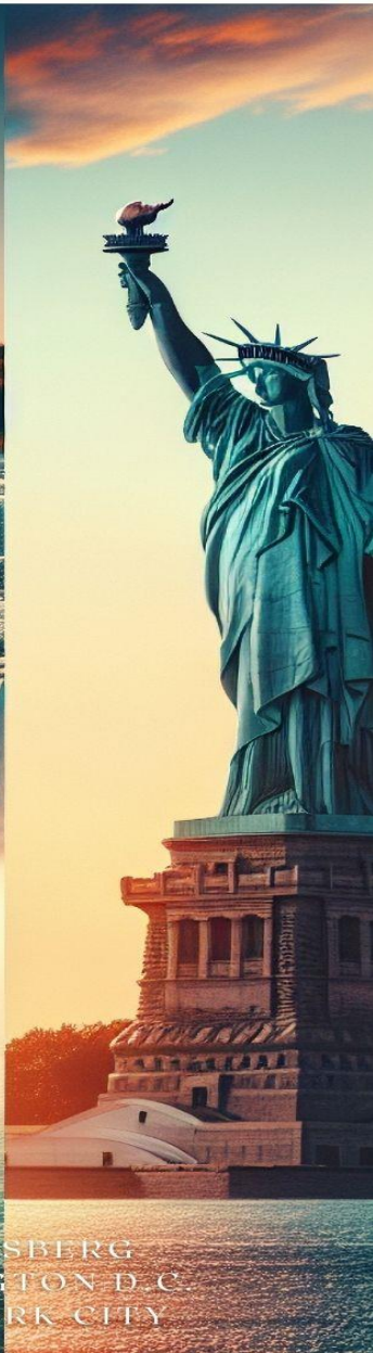
HARRISBERG WASHINGTON D.C. NEW YORK CITY