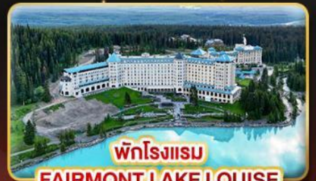
พักโรงแรม FAIRMONT LAKE LOUISE