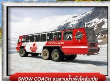
SNOW COACH ขนลาน้ำแข็งโคลัมเบีย