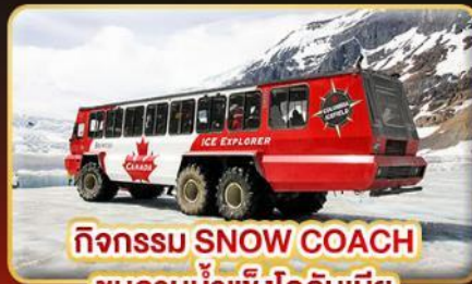
กิจกรรม SNOW COACH ชมลานน้ำแข็งโคลิมเบีย