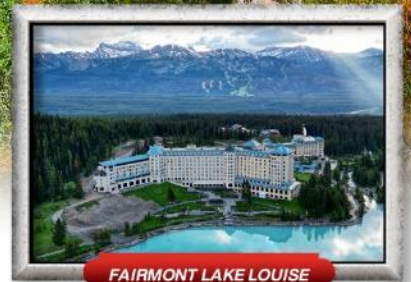
FAIRMONT LAKE LOUISE

บินทรู สายการบิน Full Service | เมนูพิเศษ! แคนาเดียนลิบสเตอร์