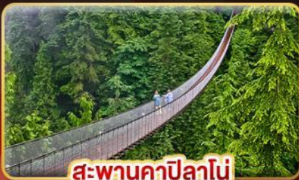
สะพานคาปิลานี