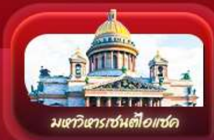
มหาวิหารเซนต์ไอแซค