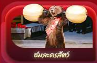
ชมละครสัตว์

สองเมืองไฮไลท์ของรัสเซียที่ไม่ควรพลาด! ตื่นตาตื่นใจกับมหาวีฬารเซนต์บาซิล ชมความยิ่งใหญ่ของจัตุรัสแดง สัมผัสอดีตที่พระราชวังเครมลิน ชมความงามของสถานีรถไฟใต้ดินมอสโก ซากอร์ส โบสถ์โอสถิกรีนดี เนินเขาเซเปร์โรว์ ชมความงามพระราชวังฤดูหนาว พิพิธภัณฑ์ฮอร์มิกง ชมละครสัตว์ (Circus Show) ป้อมปืนเตอร์แอนดอปอล และมหาวีฬารเซนต์ไอแซค