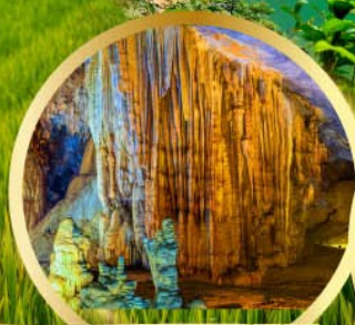
น้ำตกสวรรค์