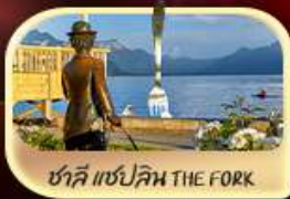
ชาลี แซปลิน THE FORK