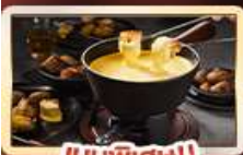
เมนูพิเศษ!! สวิสฟองดู

เบิร์น เวอว์ย เซอร์แมท อินเทอร์ลาเกน ทิตลิส ลูเซิร์น ซูริค