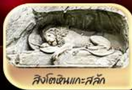
สิงโตหินแกะสลัก