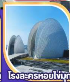
โรงละครหอยไข่มุก