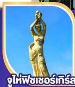
จูไห่พีชเชอร์ทิสรา