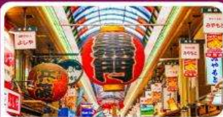
ตลาดปลาคุโรมง