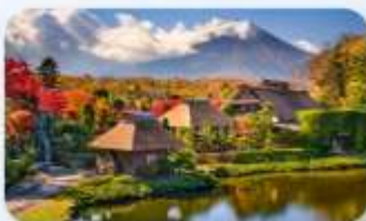
หมู่บ้านน้ำใสโอชิโนะฮักโต