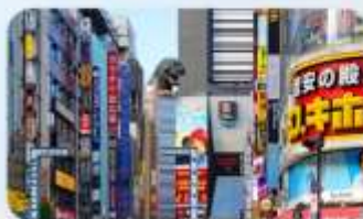
ซ้อปบั้งชินจุกุ