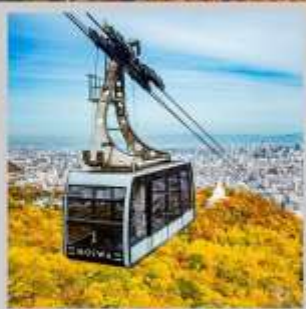
"MT. MOIWA ROPEWAY"