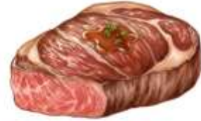
● ไก่ทานเนื้อหมู