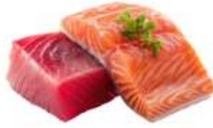
● ไก่ทานปลาดิบ