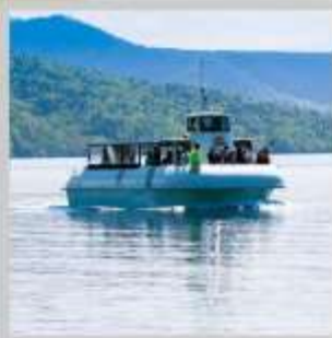
"LAKE SHIKOTSU GLASS BOAT"