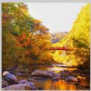
"JOZANKEI FUTAMI BRIDGE"