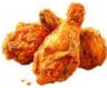
● ไก่ทานสัตว์ปีก (ไก่)