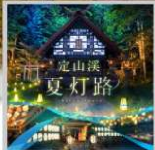
"JOZANKEI NATSU TOURO 2026"