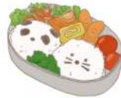
● อาหารสำหรับเด็ก ( 2-11 ปี ) *วัตถุดิบขึ้นอยู่กับทาว์ราน