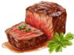
● ไก่ทานเนื้อวัว

ขอความกรุณาแจ้งวัตถุดิบที่ท่านแพ้หรือไม่สามารถรับประทานได้