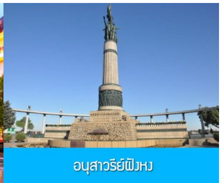
อนุสาวรีย์ผึ้ง

จากนั้นนำท่านชม โบสถ์โซเฟีย 索菲亚教堂 (ชมด้านนอก) อีกหนึ่งสัญลักษณ์ที่โดดเด่นของเมืองฮาร์บิน สร้างขึ้นในปี ค.ศ. 1907 เป็นโบสถ์คริสต์นิกายออร์ทอดอกซ์ ที่ใหญ่ที่สุดในเอเชียตะวันออก ที่แสดงถึงอิทธิพลของวัฒนธรรมรัสเซียที่มีต่อเมืองฮาร์บิน..