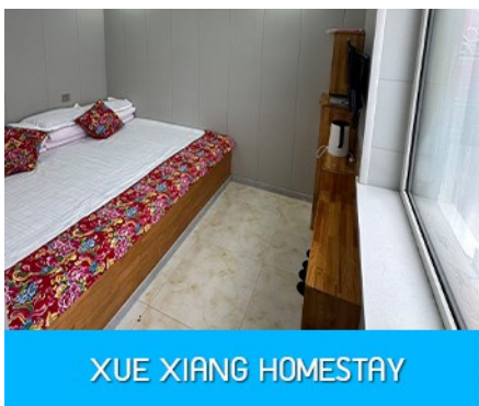
XUE XIANG HOMESTAY