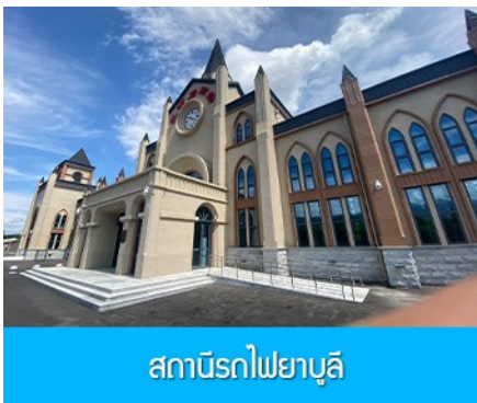
สถานีรถไฟยาบูลิ

หลังอาหารนำท่านเดินทางสู่ ยาบูลิ 亚布力 (ระยะทาง 230 กม. ใช้เวลาเดินทางราว 3 ชั่วโมงเศษ)