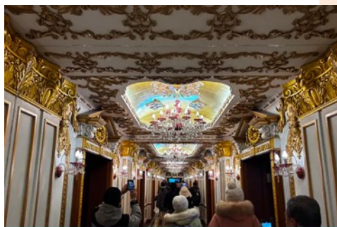
ตึกเภสัชกรรมฮาร์บิน

จากนั้นนำท่านเที่ยวชม ถนนจงยงอู่ 中央大街 ถนนสายหลักของเมืองฮาร์บิน ถนนที่เต็มไปด้วยอาคาร บ้านเรือนที่เป็นสถาปัตยกรรมตะวันตกที่สร้างในช่วงคริสต์ศตวรรษที่ 18 – 19 ที่เมืองนี้ถูกปกครองโดยรัสเซีย อีกทั้งยังเป็นถนนคนเดินที่เป็นแหล่งรวมร้านค้าสินค้าแบรนด์เนมทั้งในและต่างประเทศ ร้านจำหน่ายของที่ระลึกและสินค้าพื้นเมือง ร้านอาหารพื้นเมืองต่าง ๆ มากมาย ให้ท่านมีเวลาอิสระเดินเที่ยวและช้อปปิ้ง หรือลิ้มรสอาหารพื้นเมืองตามอัชฌาศัย.. **ให้ท่านลิ้มรสไอศกรีมชื่อดังเก่าแก่ของเมืองฮาร์บินท่านละ 1 ท่านฟรี