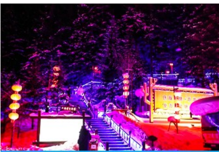
ระเบียงชมวิวยาว