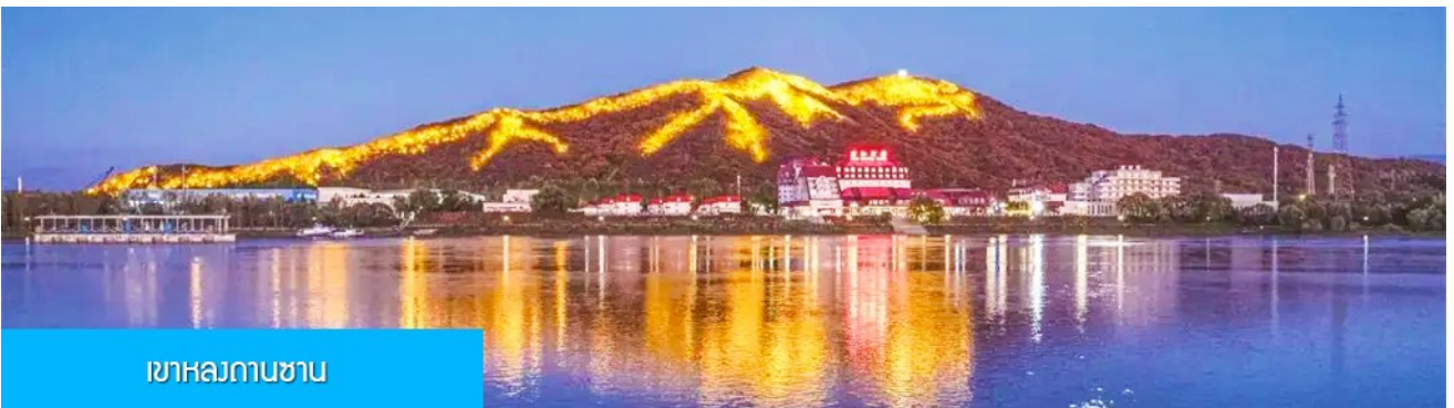
เขาสถกานซาน

หลังอาหารนำท่านผ่านชม วิวยามค่ำของเขา หลงถานซาน 龙潭山夜景 (ผ่านชมระยะไกล) ภูเขารูปทรงคล้ายมังกรในช่วงกลางคืนภูเขาจะถูกประดับด้วยแสงไฟที่สามารถมองเห็นแต่ไกล คล้ายรูปมังกร (บางคนมองว่าคล้ายรูปไดโนเสาร์) จากนั้นนำท่านเดินทางเข้าที่พัก