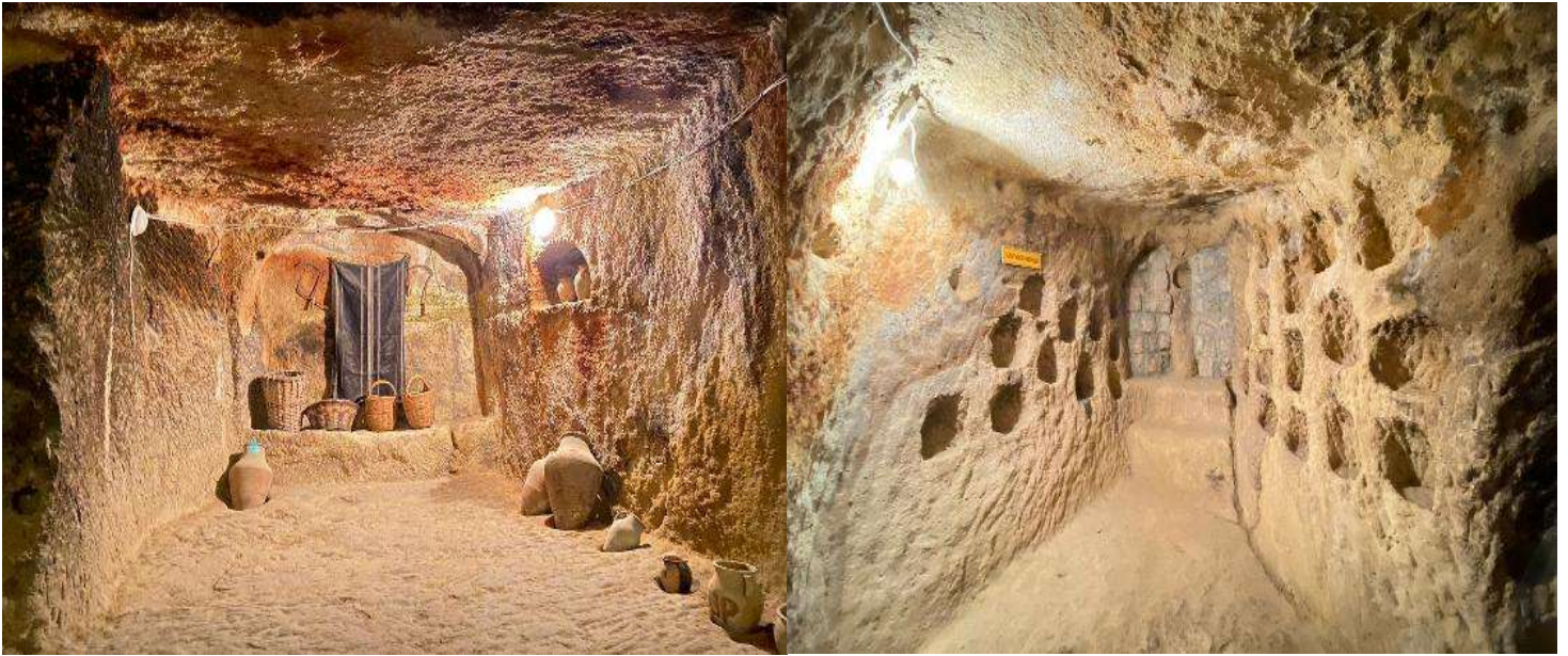
แฉะถ่ายรูป หุบเขาอุชิซาร์ (UCHISAR VALLEY) หุบเขาคัลายจอมปลวกขนาดใหญ่ ใช้เป็นที่อยู่อาศัย ซึ่งหุบเขาดังกล่าวมีรูพรุน มีรอยเจาะ รอยขุด อันเกิดจากฝีมือมนุษย์ไปเกือบทั่วทั้งภูเขา เพื่อเอาไว้เป็นที่อยู่อาศัย